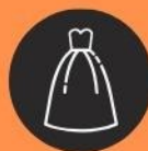
Bosses grans d'escombraries

Organitzar els taps de forma que no generem més residus, i que ens faciliti la recollida, allò ideal seria en: